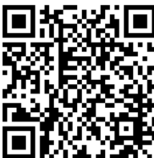
图E.2 医药产品二维码链接应用示例

如某医药产品唯一标识编码为(01)06901234567892(17)191212(10)190101(21)00001代表产品标识为6901234567892，失效日期为2019年12月12日，批号为190101，序列号为00001的医药产品，二维码链接字符串为： https://www.690699.com/gtin/06901234567892/expiry/191212/lot/190101/serial/00001 条码如图E.2所示。